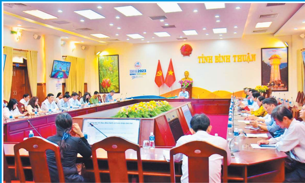
Sáng 16/10, Tổ công tác của Thủ tướng Chính phủ tổ chức họp phiên thứ 2 theo hình thức trực tuyến với các bộ, ngành địa phương. Đồng chí Trần Lưu Quang - Phó Thủ tướng Chính phủ, Tổ trưởng Tổ công tác chủ trì (Đại biểu dự họp tại điểm cầu Bình Thuận)