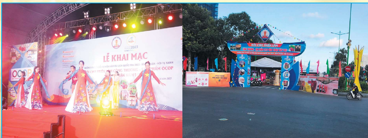
Tối 19/10, Hội chợ triển lãm Công Thương - Sản phẩm OCOP tỉnh Bình Thuận năm 2023 được tổ chức trên đường Nguyễn Tất Thành, thành phố Phan Thiết đã chính thức khai mạc.