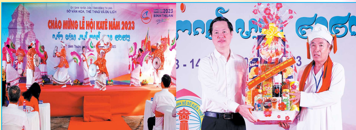
Sáng 14/10, tại Di tích tháp Pô Sah Inư đã diễn ra chương trình khai mạc Lễ hội Katê 2023. Lễ hội Katê tại tháp Pô Sah Inư năm nay tiếp tục được mở rộng quy mô với sự tham gia của đông đủ đồng bào Chăm đến từ 6 huyện trong tỉnh, gồm: Hàm Thuận Bắc, Tuy Phong, Bắc Bình, Hàm Thuận Nam, Hàm Tân và Tân Linh.