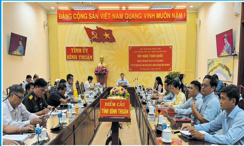
Ngày 11/10/2023, Hội nghị nghiên cứu, triển khai Kết luận số 57-KL/TW của Bộ Chính trị về tiếp tục nâng cao chất lượng, hiệu quả công tác thông tin đối ngoại trong tình hình mới (Quang cảnh Hội nghị tại điểm cầu Bình Thuận).